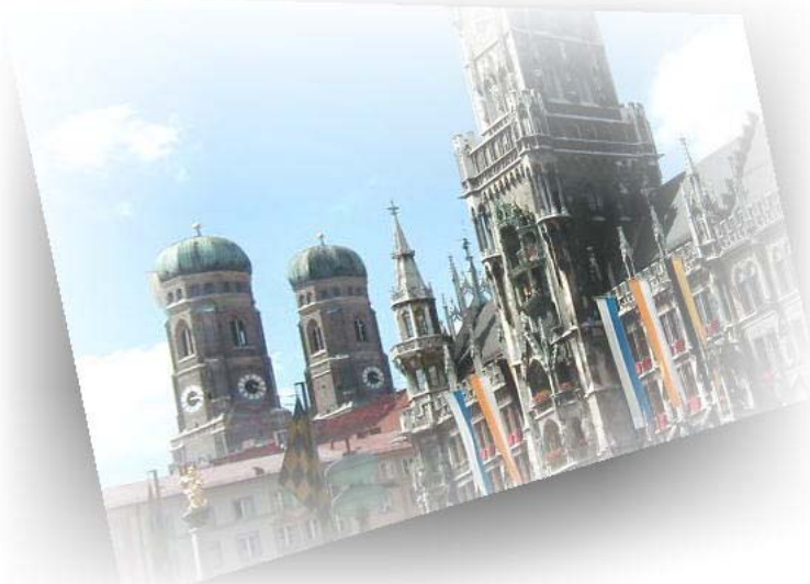
〔聖母教会・マリエン広場〕