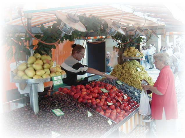
〔ビクトアアリーエン市場〕

授業終了後の一日の過ごし方は、音楽・スポーツクラブなどに所属し、各自の趣味を生かしている。ミュンヘンは、音楽・サッカーがとても盛んに行われている。子供たちも例外ではなく、いろいろな楽器を習ったり、サッカークラブに所属したり、自分の才能を伸ばそうとしている子供たちが多く、午後の早い時間に学校の授業を終え、各自いろいろな教室やクラブで活動できることはとても素晴らしいことだと思う。また、子供たちのためにいろいろな施設が用意されていることも素晴らしいことである。市内のあちこちにサッカーグラウンドや広い芝生の公園があり、とても整備されている。また、休日には公園でたくさんの人々がいろいろな運動を楽しんだり、散歩をしたりしている。