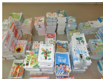
新しい教科書も届いて ますよ。