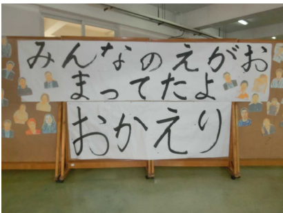
ニコニコ広場に設置した 「おかえりメッセージ」

本校職員も、いつでも学校がスタートできるよう準備を進めております。特に、各教室含め学校全体の衛生管理は、広州市教育局の指導を仰ぎながら着実に進めておりますので、ご安心ください。ご家庭においても、引き続きお子様の健康管理に気をつけて頂きますようお願いいたします。