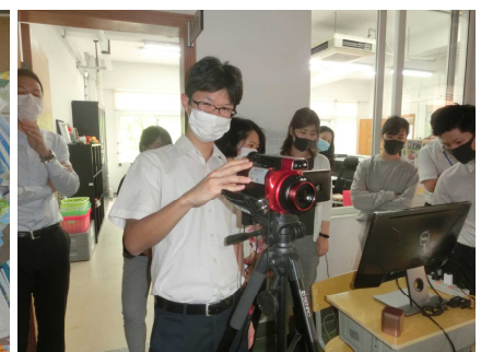
サーモグラフィを使った 体温測定を実施します。