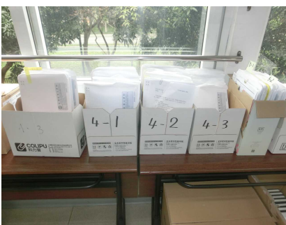
皆さんの「あゆみ」も 校長室に保管しています。