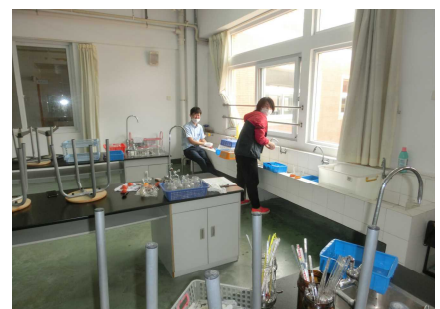
特別教室も念入りに 掃除しています。