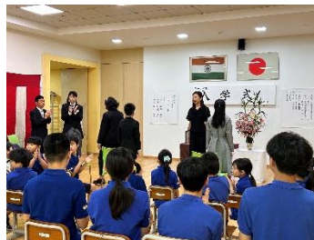
中学部新入生 少し緊張してるかな