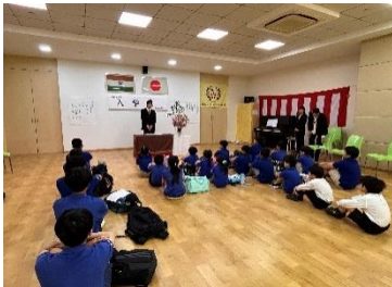
始業式 いよいよスタートです

中学生となった今、頑張りたいことが二つあります。一つ目は、英語の学習です。二つ目は、仲間とともに成長し、切磋琢磨していくことです。これからも仲間と共に成長していきたいと思えます。私たち新入生は、今日から始まる中学生生活に、期待と希望で胸を膨らませ、新たな一歩を踏み出そうとしています。ムンバイ日本人学校で過ごす一日一日を無駄にせず、実りあるものにするために、自分自身の行動に責任を持ち様々なことに挑戦していきたいです。