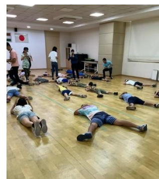
姿勢をきちんとつくれました