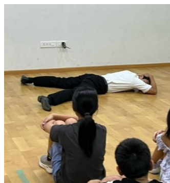
テロ対応訓練 目立たないようにします