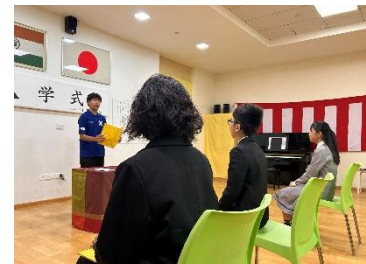
新入生歓迎の言葉 真剣に聞いてます