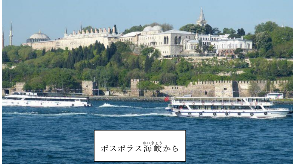
ボスポラス海峡 かいきょう から