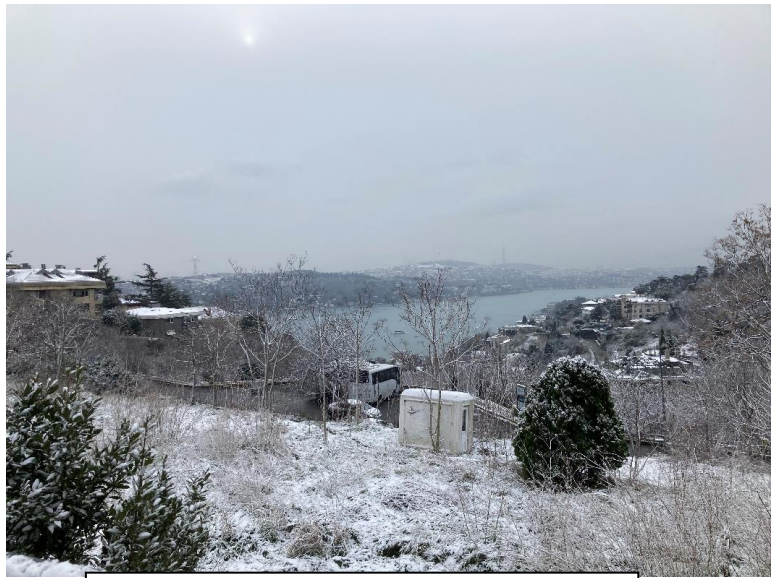
雪のボスポラス海峡

トルコに雪は降るのか？私も来るまで知りませんでした。答えは「降ります。」高い山にはスキー場があり、ウィンタースポーツを楽しむ人々で賑わいます。私が住んでいるイスタンブールも、毎年多少は降るそうですが、新潟レベルではなく、3~4日うっすら白くなる程度だそうです。