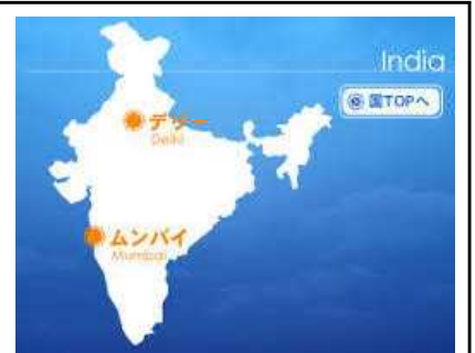
インドの首都はデリー。 ムンバイは第二の都市と言われています。