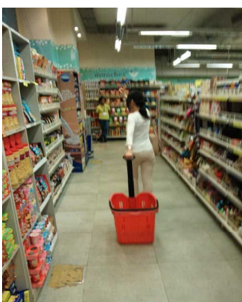
インドスーパーの様子。お買い物事情はまた後日。

インド街情報はいかがでしたか？今後は、鳥屋野小のみんなからの質問にも答えたいなと思っています。先生への質問は担任の先生に伝えてね！