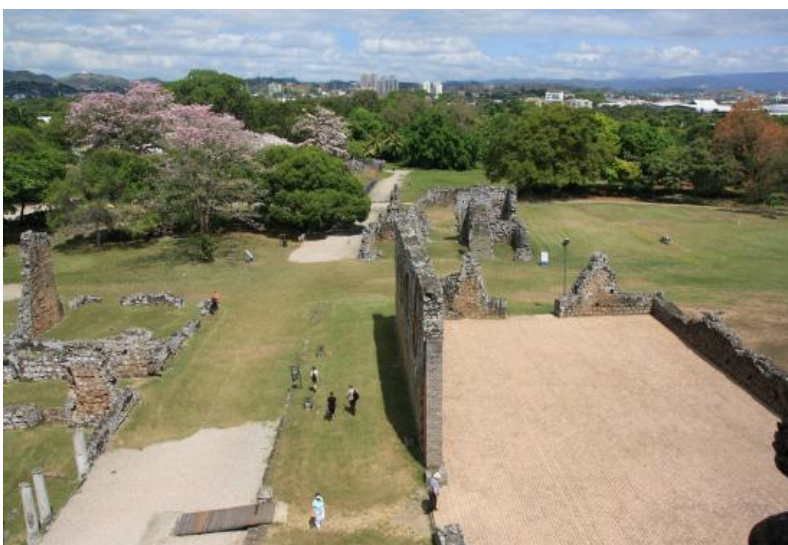
鐘楼から見た「パナマビエホ」の町並み