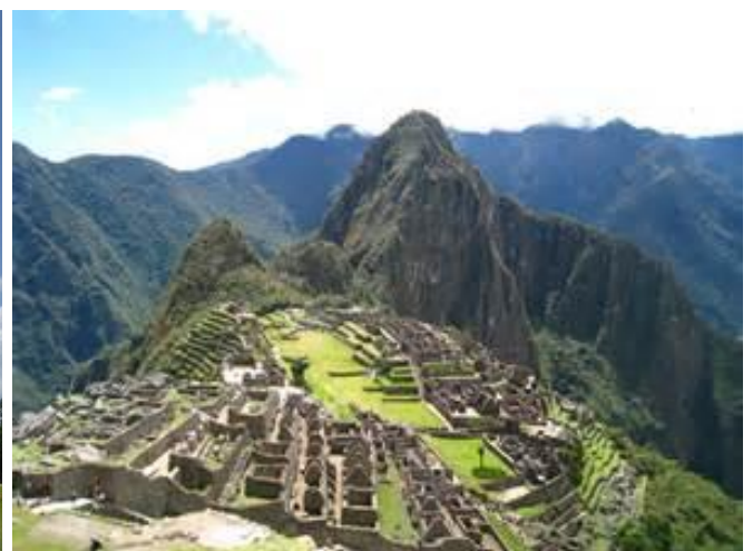
「インカ帝国」 マチュピチュ遺跡