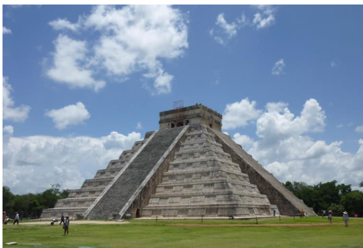
「マヤ文明」 チェチェンイツアのピラミッド