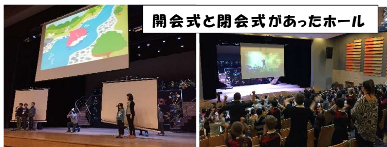
開会式と閉会式があったホール