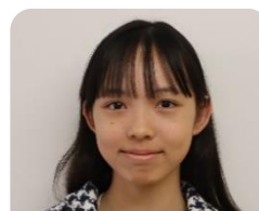
後期委員会委員長

前期の後半から生活・飼育・図書・ハッピーと一人一人の分担を決めて仕事をしてきました。後期も、仕事が多いので、がんばります。